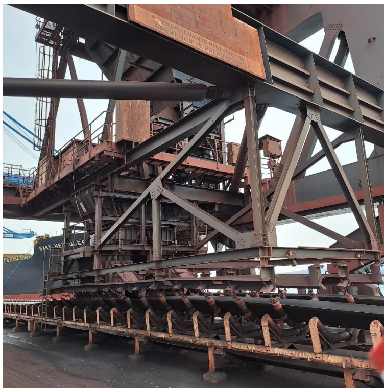
Slika 1: Spodnji del dvigala MD2

Luka Koper, d.d., Terminal za razsute in tekoče tovore, Mostno dvigalo MD2